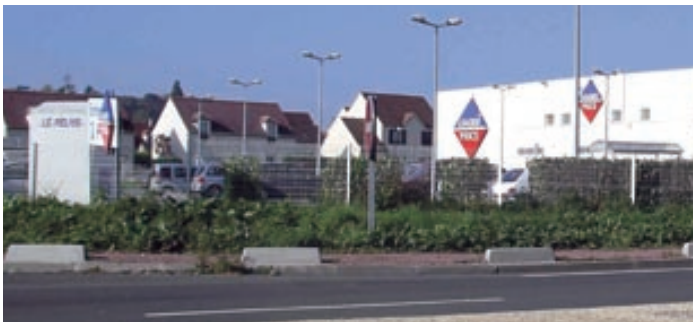
Lotissements récents à Maffliers proches de la N1. Attention à ne pas créer de nouveaux flux sur le secteur.

Dans les solutions A, B et C, l'impact sur l'activité agricole est très important, il entraînerait inévitablement l'impossibilité de cultiver certaines terres (entre autres la cueillette de la Croix Verte) ; elles pourraient alors devenir constructibles ce qui engendrerait de nouvelles habitations, de nouveaux flux, de nouveaux problèmes environnementaux.