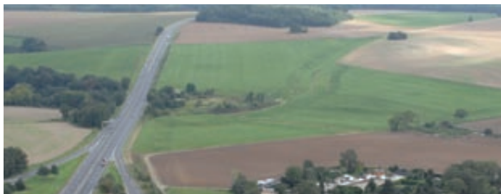
Massacre des terres agricoles et des forêts par la N1 au Nord de Maffliers : cette situation n'est pas encore irréversible si on adopte la solution D.

*En cas limite, si la N1 était coupée à la hauteur de cet échangeur, il n'y aurait plus aucune circulation dans Maffliers et Montsoult.