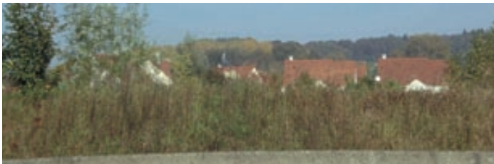
Lotissement de maisons récentes à Baillet vu de la Francilienne.