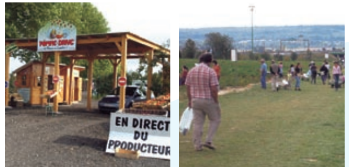
Ventes sur place dans le secteur de la Croix-Verte

Le maître d'ouvrage devrait alors mettre en œuvre des mesures compensatoires importantes pour redonner à ces entreprises les conditions indispensables au maintien et même au développement de leur activité : création d'une « vitrine » commerciale, accès aux lieux de vente, parkings, etc.